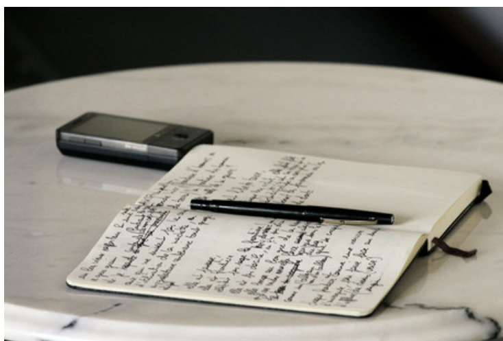
Auteur : Myriam Martin