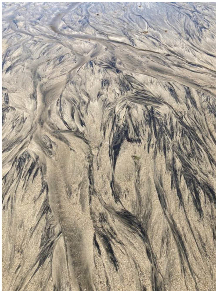
Auteur : Estelle Dumortier

En savoir plus sur la compagnie : https://www.facebook.com/Latraversante