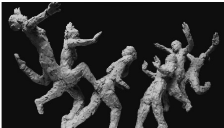
Auteur : Emilie Tolot