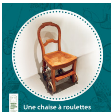
Une chaise à roulettes