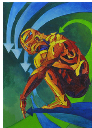
Auteur : Myriam Sitbon

Voilà bientôt 20 ans que l'atelier de peinture intersectoriel du CH Le Vinatier permet à une trentaine d'artistes, suivis en soin à l'hôpital ou en ville, de bénéficier d'un accompagnement privilégié lors de séances hebdomadaires.