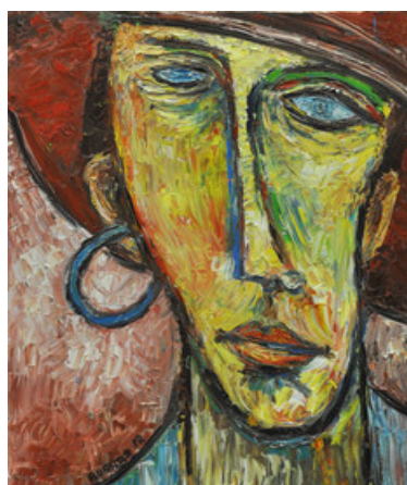
Auteur : Didier Burgaz

Encadrés par le peintre professionnel Jacques Chananeille, les artistes donnent libre cours à leur imagination et produisent des œuvres aux styles et univers très variés, régulièrement exposées dans des lieux de l'agglomération lyonnaise.