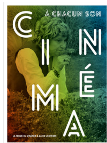
Auteur : Photographie : Jérôme Beffay Copyright : Graphisme : Perluette & BeauFixe

Tout au long de l'année 2020, et malgré un entracte de quelques semaines dû à la situation sanitaire en France, les artistes de la Cie Zéotrope ont investi l'hôpital et transformé la Ferme du Vinatier en véritable studio de cinéma. Ces joyeux drilles, spécialistes de la création participative tout terrain, ont ainsi invité les publics à remonter le temps en créant des zoétropes (machines optiques donnant l'illusion du mouvement à partir de photographies ou de dessins), à inventer des paroles sur des musiques de films connus, à tourner des courts-métrages, à rejouer des scènes de films cultes... Autant de manières de créer en dépassant les contraintes sanitaires du moment (imaginez la scène du baiser de Titanic avec un masque chirurgical...). Un vidéaste devait réaliser un documentaire autour de ce projet... mais comme rien ne s'est passé comme prévu, il s'est fait happer par la joyeuse troupe... Nous vous laissons découvrir dans le DVD et le livret ce qui s'est réellement passé dans ce projet !