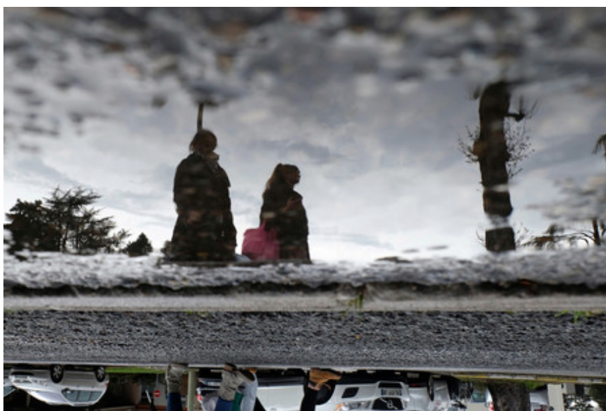
Auteur : ERNESTOPHIL

Dans le cadre du dispositif Eclats d'Art, la Ferme du Vinatier a proposé un projet transversal et participatif à tous les services du centre hospitalier sous la forme d'un concours photographique. Pendant sept semaines, usagers et agents du centre hospitalier ont été invités à s'exprimer librement sur l'hôpital d'aujourd'hui autour du thème 100 clichés à l'hôpital .