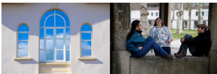
Auteur : Les flous furieux