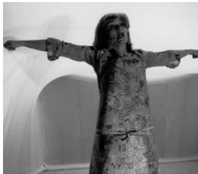
Tes désirs font désordre