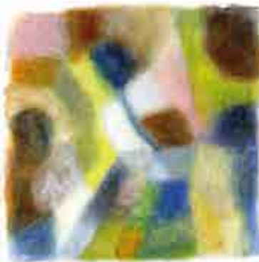
« Mars »

ticulièrement connue depuis la méta-analyse de Cantor-Graae et Selten en 2005 2 puis celle de Bourque et ses collaborateurs en 2011 3 qui retrouvent toutes deux une augmentation du risque de psychose pour les populations migrantes, d'autant plus marqué chez les enfants d'immigrés. Récemment, une étude réalisée dans le Nord (Amad et al., 2013) 4 a permis de valider l'existence du sur-risque de schizophrénie pour les populations immigrées en France, et leurs descendants jusqu'à la troisième génération. Le risque était ainsi augmenté au sein des trois générations, tant pour les épisodes psychotiques uniques que pour les épisodes psychotiques récurrents. Face à ce sur-risque de psychose pour les populations migrantes de par le monde, certains chercheurs comme le Pr Jean-Paul Selten, de l'Université de La Haye, n'hésitent pas à évoquer le terme « d'épidémie » tout en dénonçant les résistances qui peuvent exister à l'acceptation scientifique, politique et sociétale du phénomène 5 .