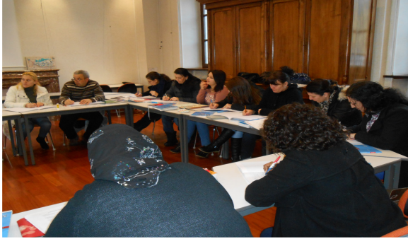
Travail en groupe

Le groupe se réunit 2 fois par semaine au collège -Annecy