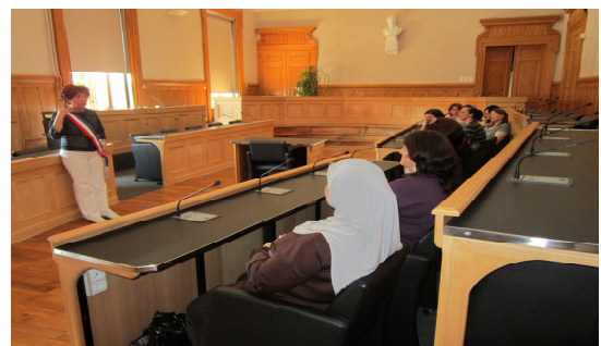
Présentation des parents Echange sur la vie quotidienne en France