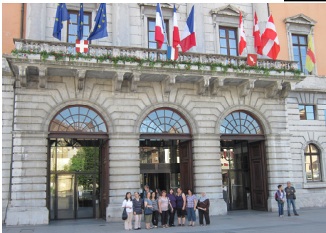
Accueil du groupe Visite des principaux services