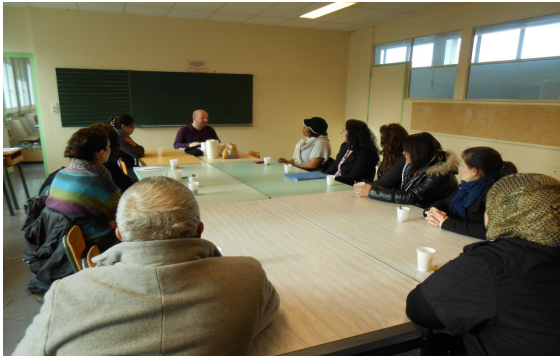
Echange avec le directeur de l'école élémentaire