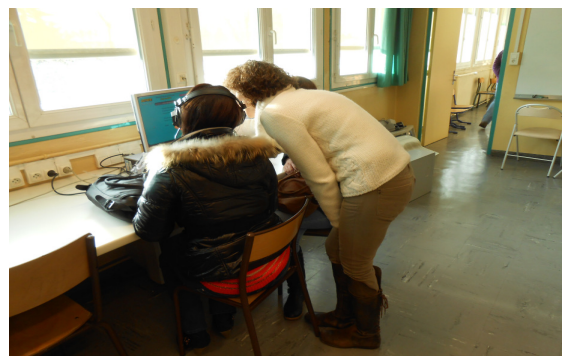
Rencontre avec la maîtresse d'UPE2A (unité pédagogique élèves allophones arrivants)