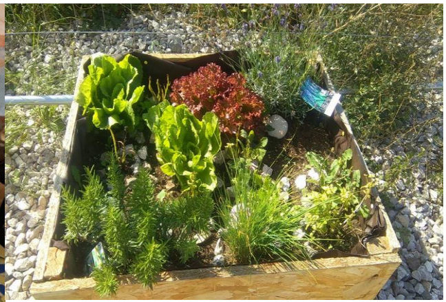
Activités maraîchage - tente psychosociale de Calais