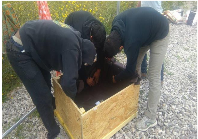
Activités maraîchage - tente psychosociale de Calais