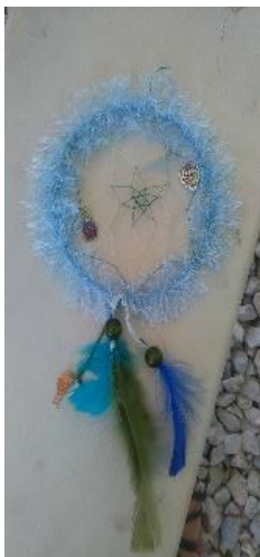
Activités - tente psychosociale de Calais