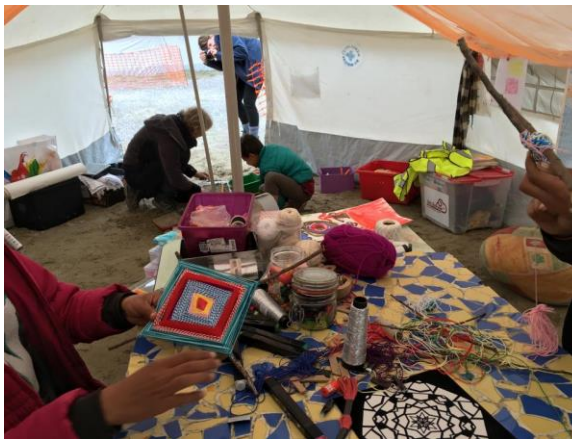
Activités - tente psychosociale de Calais