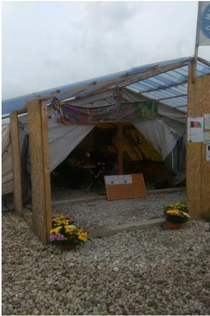
La tente psychosociale de Calais