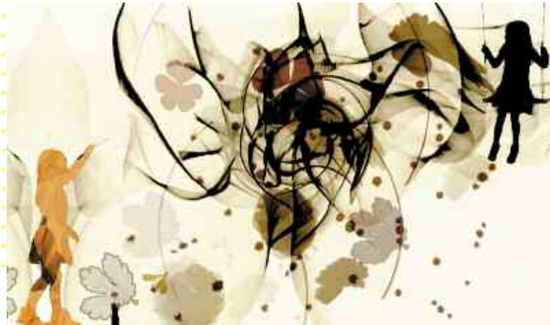
Le secret de Berthe

En première partie, L'Atelier du lundi , un ensemble de jazz du conservatoire (ainsi nommé parce qu'il répète... le lundi!) alternera standards du jazz et nouvelles compositions.