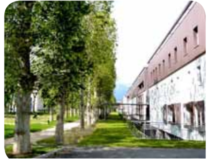
Le projet Hôpital 2012

2015 : ouverture du Service Médical d'Accueil des Urgences Psychiatriques (SMAUP) ;